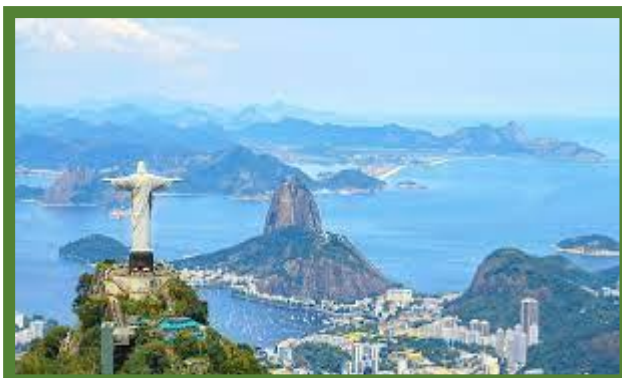
Le Christ Rédempteur sur Corcovado.