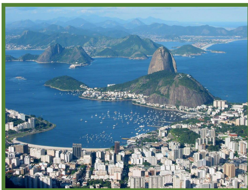
Rio de Janiero