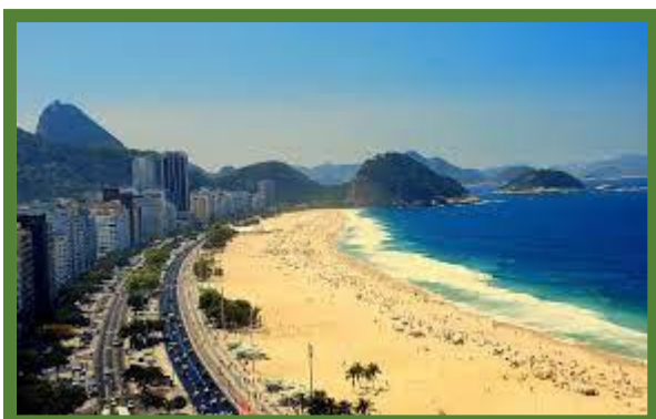
La plage de Copacabana

Repas inclus : Déjeuner, dîner et souper.