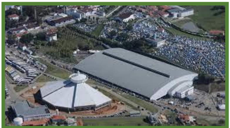
Le sanctuaire du Père Miséricordieux à Canção Nova.