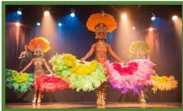
Spectacle Ginga Tropicale.