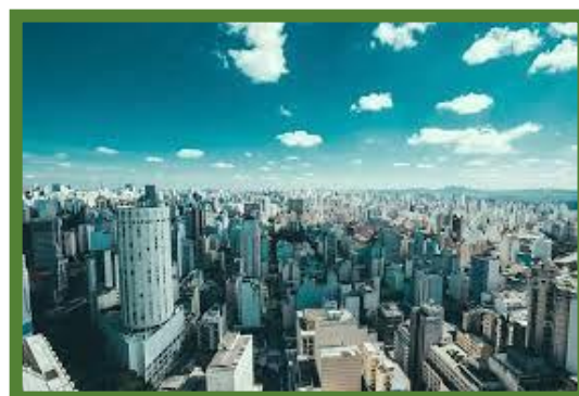
La ville de Sao Paulo